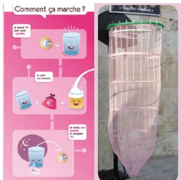
Les verres consignables et la poubelle ludique