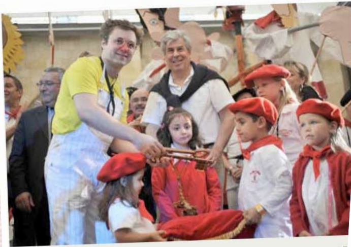
Festival Bandas 2010 à Condom (AMAT MICHEL)

Les musiciens et les festayres ont pris possession de la ville jusqu'à demain