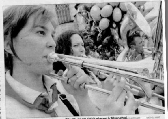
Les Bundy's se produiront dans un Zénith de 180 000 places à Shanghai.

une reconnaissance mondiale de cette musique. Nous sommes heureux et fiers d'être ainsi les ambassadeurs du Sud-Ouest et d'aller porter les bas valeurs de fête et de convivialité », explique Guy Le Berre.