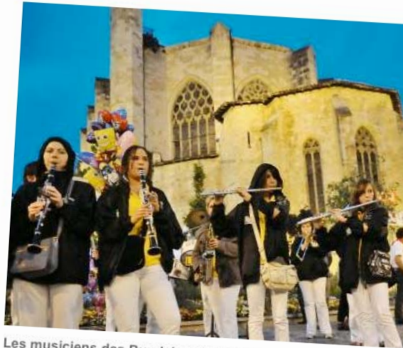
Les musiciens des Bundy's ont à nouveau déployé tous leurs talents d'animation hier soir lors de la soirée gersoise.

Meilleure banda gersoise 2009, l'ensemble de Lupiac fera résonner la musique du Sud-Ouest à l'Exposition universelle de Shangaï dans un mois.